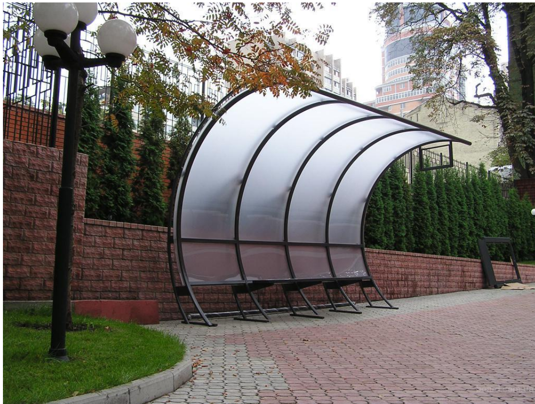
Вариант № 1